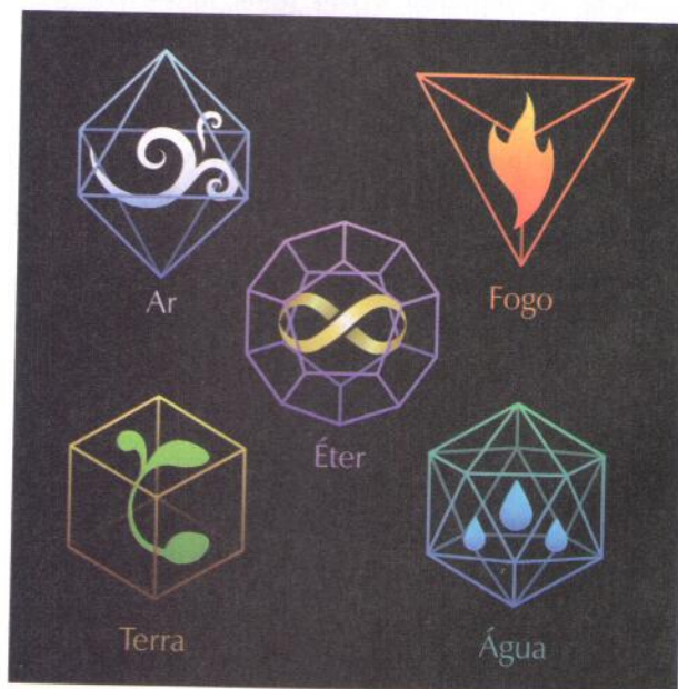
Sólidos platônicos ajudam a estender o formato do universo

Quando hoje se fala em partículas subatômicas como léptons, quarks e bósons, entendo que isso é apenas uma evolução da ideia platônica primordial. De fato, no Timeo as partículas elementares são o fogo, a terra, o ar e a água. Cada um desses elementos está associado a um dos cinco sólidos platônicos que são os únicos poliedros regulares no espaço tridimensional, e são, respectivamente, o tetraedro, o cubo, o octaedro e o icosaedro. O quinto sólido platônico, o dodecaedro, com suas 12 faces pentagonais, cada uma delas associada a um animal do zodíaco, segundo Timeo, representa o cosmos. Em um artigo da revista Nature de 2003, os autores J.P. Luminet, J. Weeks e outros astrônomos de reputados centros de pesquisa na França e Estados Unidos, apresentam um modelo que possivelmente explica o formato do nosso, ainda tão desconhecido universo. O resultado, deduzido de dados obtidos dos mais potentes satélites e telescópios é um modelo tridimensional, sem borda, equivalente ao dodecaedro na quarta dimensão. Em outras palavras, alegorias platônicas do século IV a.C são, de certa forma, verificadas experimentalmente no século 21. Platão é o máximo!