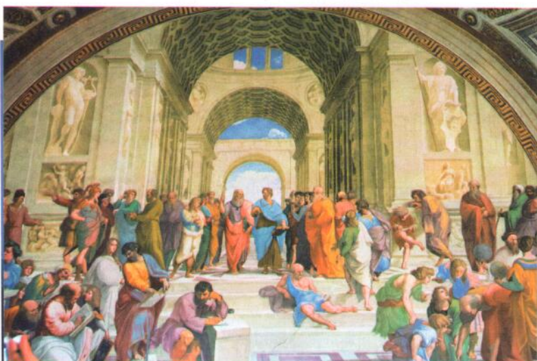
A Escola de Atenas, de Raphael. No centro, Platão conversa com Aristóteles. Cada um carrega um livro. Platão tem o Timeo.